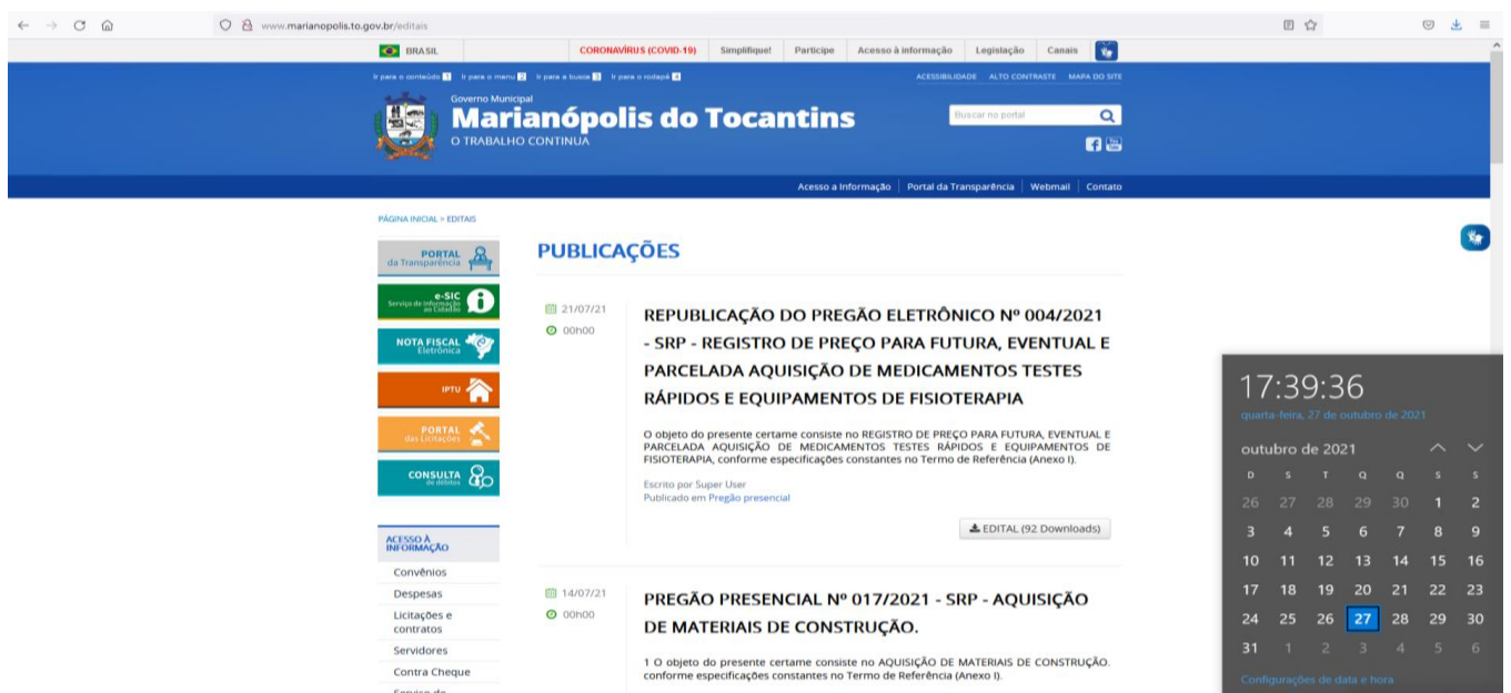
Imagem 3: Site da Prefeitura, Publicações e Editais

No Site da Prefeitura, por sua vez, nota-se que a página a qual se é remetida encontra-se desatualizada, visto que a última publicação está datada em 21/07/2021, conforme demonstrado a seguir.